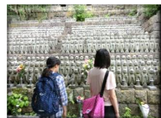
お地藏さんいっぱい～い！