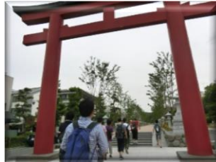
新しくなった段葛！ だんかすら