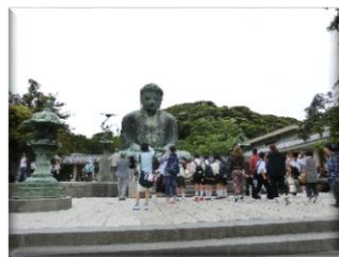
きれいになった大仏！