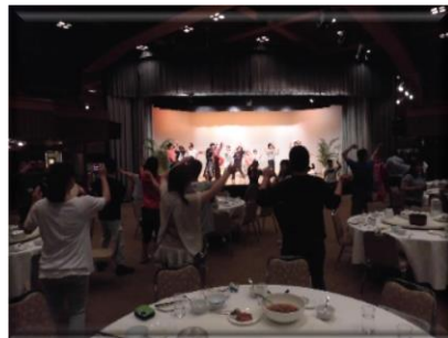
チャンカ！ チャンカ！