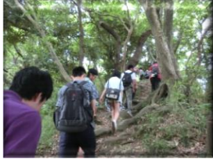
体力づくりの成果！