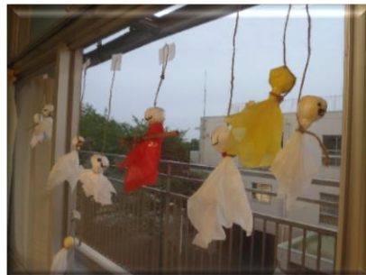
汎汎坊主のおかげです！